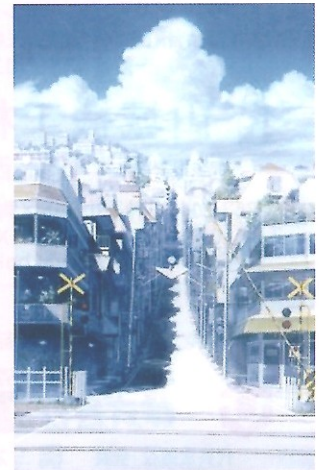
「時をかける少女」 踏切 © 山本 二三

野坂昭如の名作を、高畑勲監督がアニメーションとした「火垂るの墓」(1988)、宮崎駿監督「もののけ姫」(1997)、筒井康隆のジュブナイル小説をアニメ化した細田守監督「時をかける少女」(2006)などの作品は、山本二三が美術監督をつとめました。山本二三の背景画は、入念な取材と、精密なスケッチに基づいて描かれています。本展は、アニメーションに用いられた背景画、その前段階で描かれるスケッチ、イメージボードなど約180点を、作者みずからの選出によって、初期から最新作まで一堂に紹介しようとする初めての画期的な展覧会です。