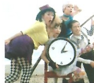
大道芸 to R mansion