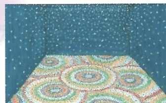
モトコー6 284番 「銀の雨・金の環」 チーム 銀の雨

高架下の空き店舗を活用して、創造的人材の活動拠点を創り、高架下の風情を大切にしつつ、人の流れを創出し、まちの魅力として発信していくプロジェクト。既に始動している箇所もあり、制作過程も楽しめる。