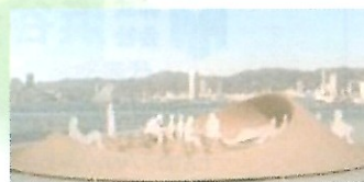
しつらいアート国際展 「Crater Lake」 24 Studio