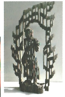
モトコー1 151番 「BUTSU-ofudousan」 本堀 雄二